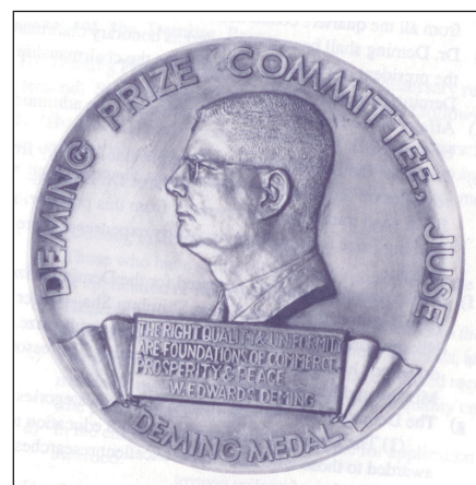
Figur 1: Deming prisen